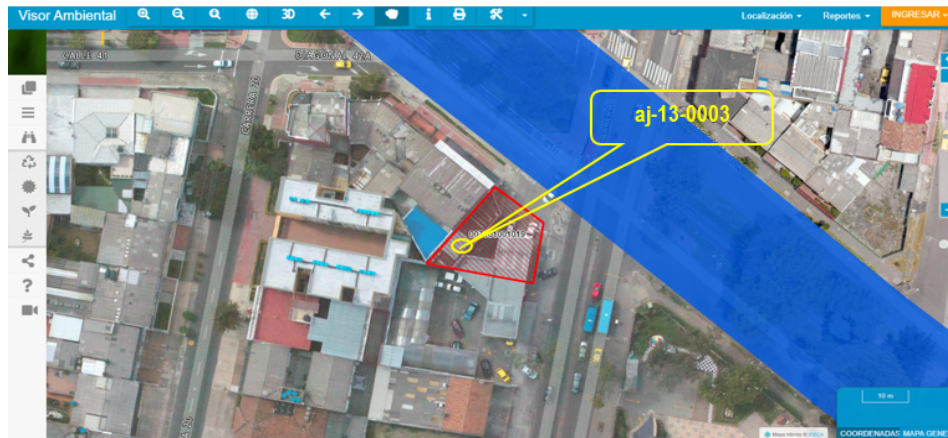
Imagen No 2. Ubicación del aljibe aj-13-0003

Mediante la herramienta Visor Ambiental se identifica que el aljibe aj-13-0003, NO se encuentra afectado por zona de manejo y preservación ambiental, corredor ecológico, ni ronda hídrica, según lo establecido en el Decreto 190 de 2004, modificado por la Resolución 228 de 2015 en la cual se precisa el límite del perímetro urbano y se dictan otras disposiciones.